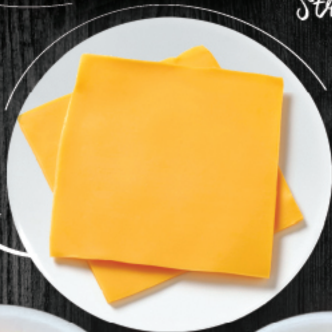
پنیر ورقه‌ای Sliced Cheese