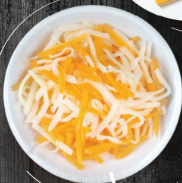
پنیر چدار و پروسس رنده Cheddar & Process Shredded Cheese