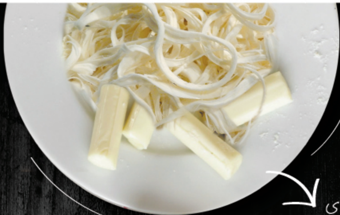
پنیر رشته‌ای String Cheese